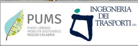
Figura 7.3 Dicembre 2016

PIANO URBANO DELLA MOBILITA' SOSTENIBILE DEL COMUNE DI REGGIO CALABRIA Flussi di traffico nell'ora di punta della mattina di un giorno ferialo invernale tipo (7:30-8:30). Scenario di Breve/Medio Periodo